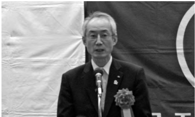
祝辞を述べる三輪教育次長

続いて「長野県PTA連合会結成70周年記念式典では『チーム信州PTA70周年ビジョン』と『信州PTAモデル』を発表した。県P連合会は保護者と教職員との距離感が近く、厚い信頼関係で結ばれていること、関係諸団体との連携が密であることを目指している。これから『私』や『私の子ども』だけでなく、『私たちの子どもたち』として、みんなで全ての子どもたちを育てる意識とチームワークで、生き活きとした大人の背中を見せながら楽しく活動してほしい」と力強く語った。