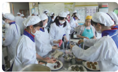
おやき作りを体験中

丸子コスモス大学 「地域に学び、地域と共に学ぶ」を願いとしたり丸子コスモス大学は、15年前から開かれている。信州型CSに加え、地域の方が生徒と一緒に受講できることが特徴だ。コスモス大学の名前は学校で大切に育てているコスモスの花にちなんで命名された。