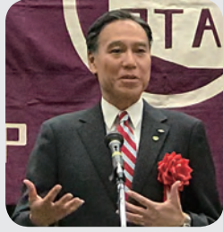
長野県知事 阿部守一氏

長野県PTA連合会は平成30年度に結成70周年を迎え、平成31年4月13日信濃教育会館において記念式典を挙行了。阿部守一長野県知事をはじめとする来賓の方々、平成20年度からの歴代の正副会長など120名が出席した。