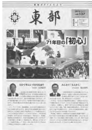
〔東部〕（定例日よりタイムリー号）