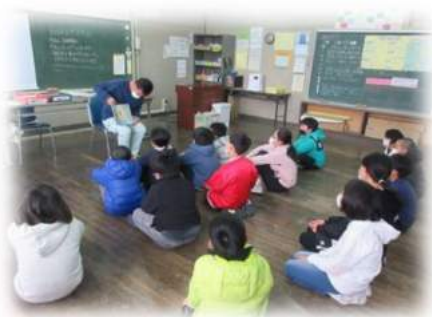
お父さんによる読み聞かせ