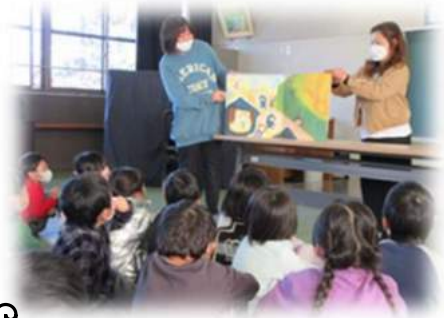
役員による大型絵本