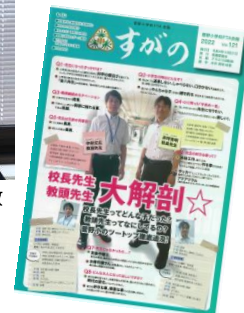
年1回発行の「すがの」