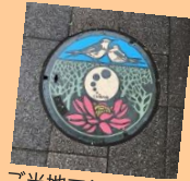
ご当地マンホール♪