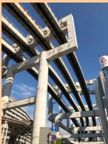
千葉モノレールの「軌道けた」街なかで見ると圧倒されます

今大会は7つの分科会がありました。会場ごとにテーマが設定されています。千葉県内外のPTAや協議会の研究発表(取り組みの発表)は今後のPTA活動の参考になり、学ぶことが多いです。