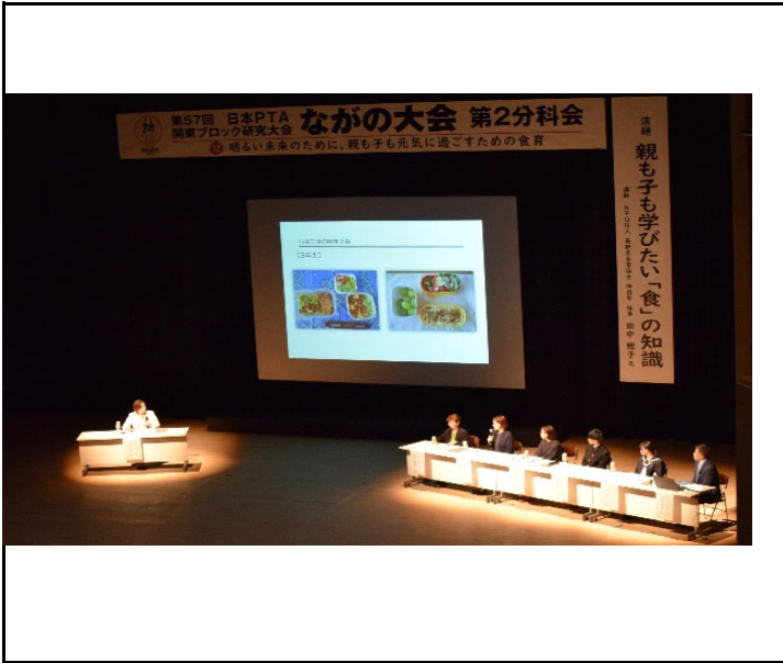
東中学校生徒とのパネルディスカッションの写真