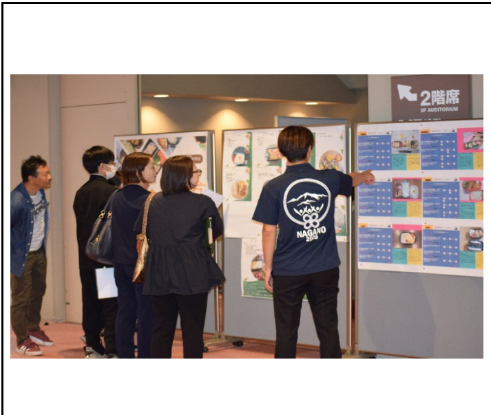
展示ブースの写真