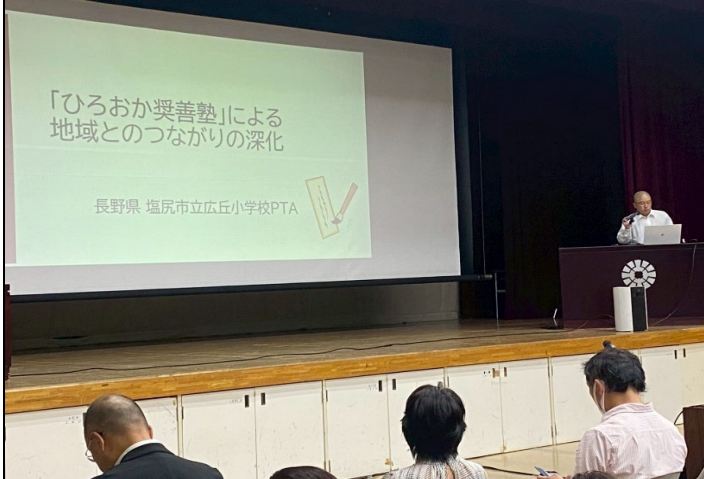
研究発表(塩尻市立広丘小学校PTA)の写真