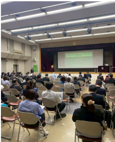
孫の手プロジェクト(塩尻市立塩尻西部中学校)の写真