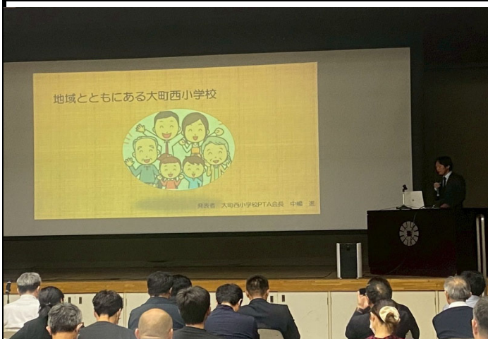
研究発表(大町市立大町西小学校PTA)の写真