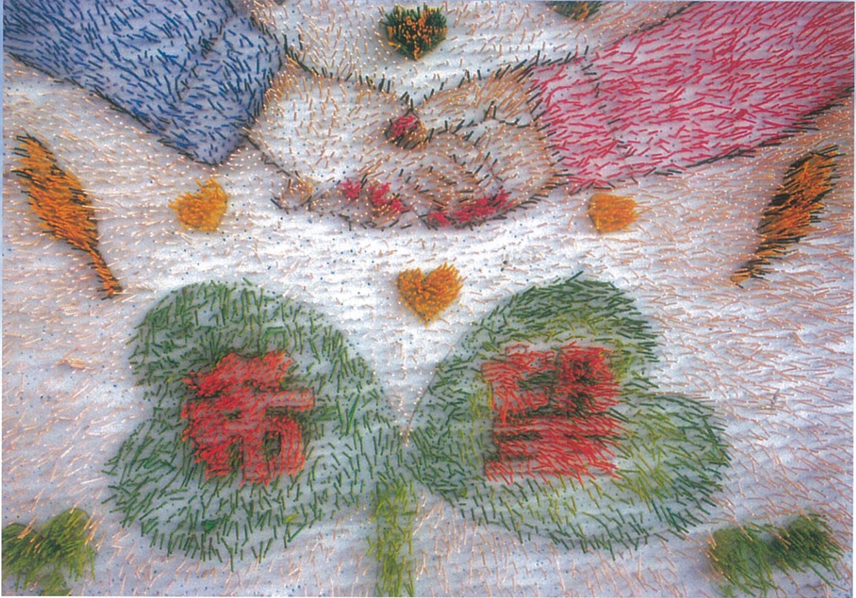
「宮城県気仙沼階上小学校へ希望の思いをこめて」爪楊枝アート 伊那市立美篤小学校 あおぞら学年 平成23年度